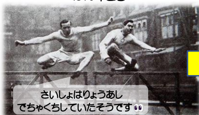
さいしょはりょうあし でちやくちしていたそうです☺